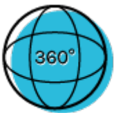
Visite de l'atelier

Vous allez développer votre potentiel d'adresse, votre méthode de travail et votre sens des responsabilités. Vous allez aussi acquérir des compétences en techniques de vente et en gestion.